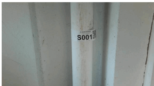
S1 - 2 (S1)